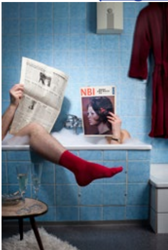
Mahsa Esmaeili: Rote Socke , 2017, 120 × 80 cm, Fine Art Print

Per E-Mail an: post@emerging-artists.com