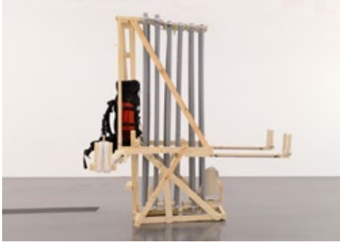
Jascha Fidorra: Papiergleiturmruksack , 2015, Min. 2,75 × 1,2 × 2,1 m Max. 3,4 × 1,8 × ca. 8,7 m, Holz, Metal, Plastikrohre, Wanderrucksack, Papier

Bewerben können sich vom 16. Juli bis zum 31. August 2018 alle GrafikerInnen oder Grafikerteams unter 35 Jahren mit Standort in Dortmund.