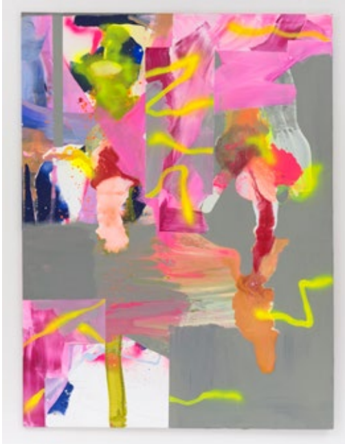
Steffen Mischke: Das Gegenteil von schwul ist schwul gemeint , 2017, 200 × 150 cm, Acryl und Sprühlack auf Leinwand

Wir suchen junge GrafikerInnen oder Grafikerteams, die das Design der kommenden Ausgabe von Emerging Artists Dortmund (Laufzeit der Ausstellung auf der UZWEI im Dortmunder U: September bis November 2019) entwickeln – was das alles umfasst, könnt ihr umseitig in den Ausschreibungsbedingungen nachlesen.