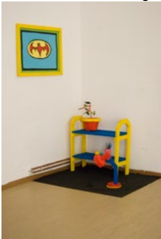
Cornelius Grau: Eckregal , 2012, 100 × 75 cm, Holz, Kabel, Baumwollstoff, Arcyl und Lack. All-Posters , 2012, 72 × 52 cm, Scherenschnitt

Daher entstehen nicht nur das grafische Erscheinungsbild und die Ausstellungsgestaltung, sondern auch die Fotografien sowie das Vermittlungsprogramm in Zusammenarbeit mit Studierenden und Absolventen der hiesigen Hochschulen.